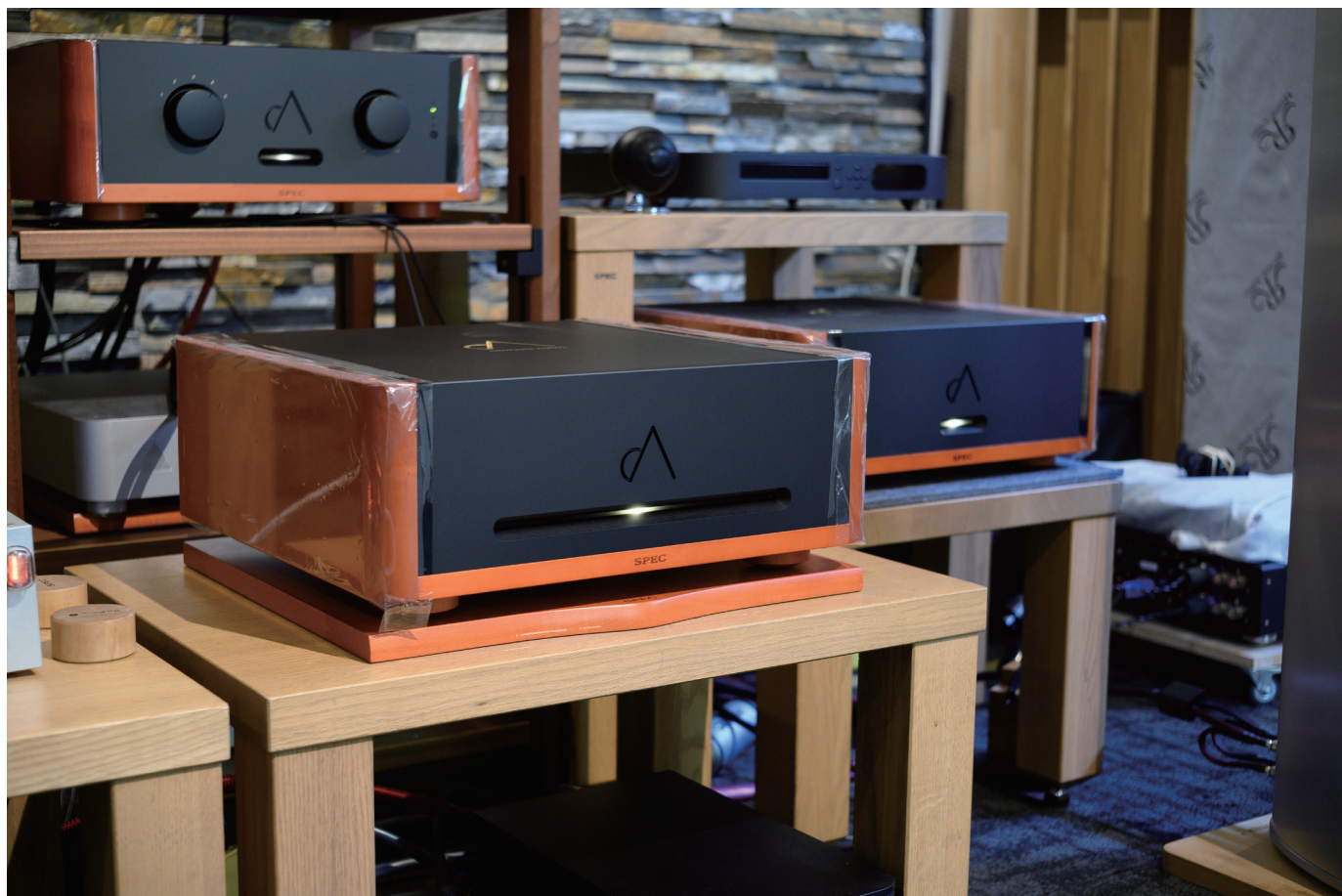
● Spec RPA-MG3000後級的音質極度純淨溫潤，非常適合與Coax 811搭配。

弦樂質感的表現方面，Coax 811能呈現非常華麗鮮明的音色，也能如實呈現高音強奏的穿透力與凝聚線條，完全掌握了音樂中不可獲缺的激昂感，不過另一方面，琴音穿透力雖然強勁，但是聽感上卻毫不壓迫刺耳，而是依然能展現自然滑順細緻的琴音質感。Piega獨家大面積鋁帶同軸單體的獨門優勢，我今天終於體驗到了。