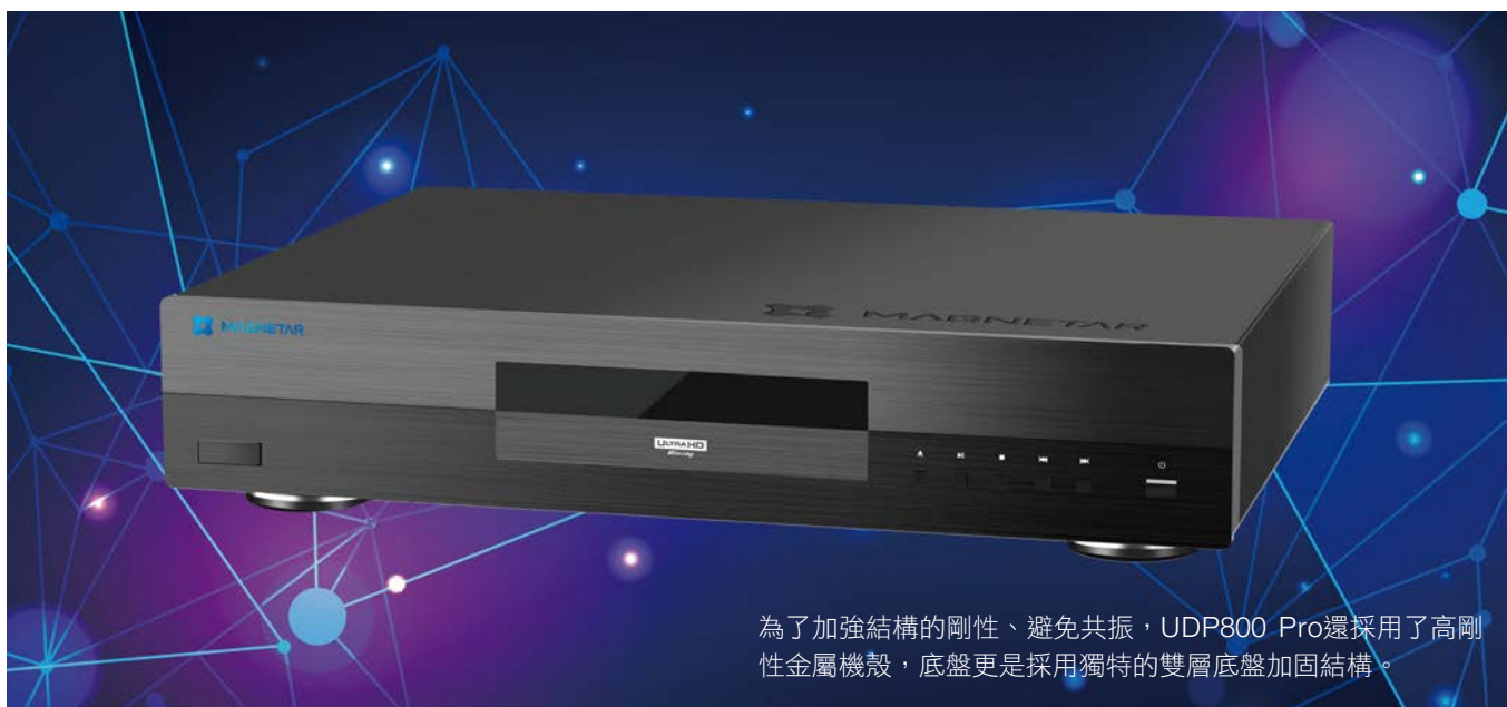
為了加強結構的剛性、避免共振，UDP800 Pro還採用了高剛性金屬機殼，底盤更是採用獨特的雙層底盤加固結構。

置一枚Burr-Brown PCM1795 DAC晶片進行數位類比轉換，個別處理左聲道和右聲道，如此做法能擴大左右聲道的分離度，同時提高音樂的動態範圍。在DAC處理過後，後端採用高音質的Muses 8920運算放大器OP-AMP。而在最後的輸出端子部分，還提供了XLR平衡輸出，當然，它也有RCA單端輸出，兩種輸出都是採用鍍金端子頭。