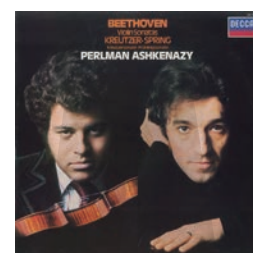
貝多芬：小提琴奏鳴曲— 春&克羅采：帕爾曼/阿胥肯納吉 44.1kHz/16bit音樂檔

DTS Demo Disc藍光測試片中有許多精采的電影片段，可以充分展現多聲道喇叭的音效實力。實際測試Monitor SE系列喇叭，會發現各聲道的聲能表現是平衡的，且聲音形體鮮明、立體，因此在環繞音效的銜接上更完整、感覺不到斷層，輕鬆享受身歷其境電影音效。