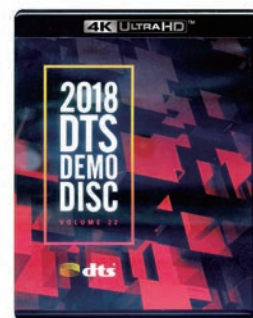
2018 DTS Demo Disc Blu-Ray Disc

DTS Demo Disc藍光測試片中有許多精采的電影片段，可以充分展現多聲道喇叭的音效實力。實際測試Monitor SE系列喇叭，會發現各聲道的聲能表現是平衡的，且聲音形體鮮明、立體，因此在環繞音效的銜接上更完整、感覺不到斷層，輕鬆享受身歷其境電影音效。